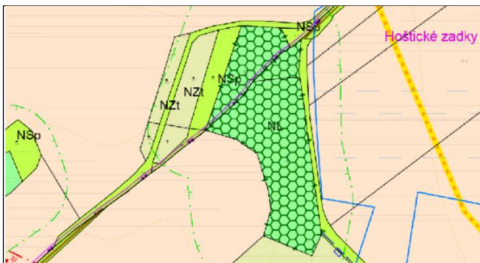
Obrázek č. 1: Výřez územního plánu

Oceňované pozemky se nachází jižně od rodinného domu č.p. 92. Pozemky parc.č. 940 a 941 jsou dle územního plánu zařazeny v plochách NZt – plochy zemědělské (trvalý travní porost) a pozemek parc.č. 942 v plochách NSp – plochy smíšené nezastavěného území (přírodní), viz. obrázek č. 1.